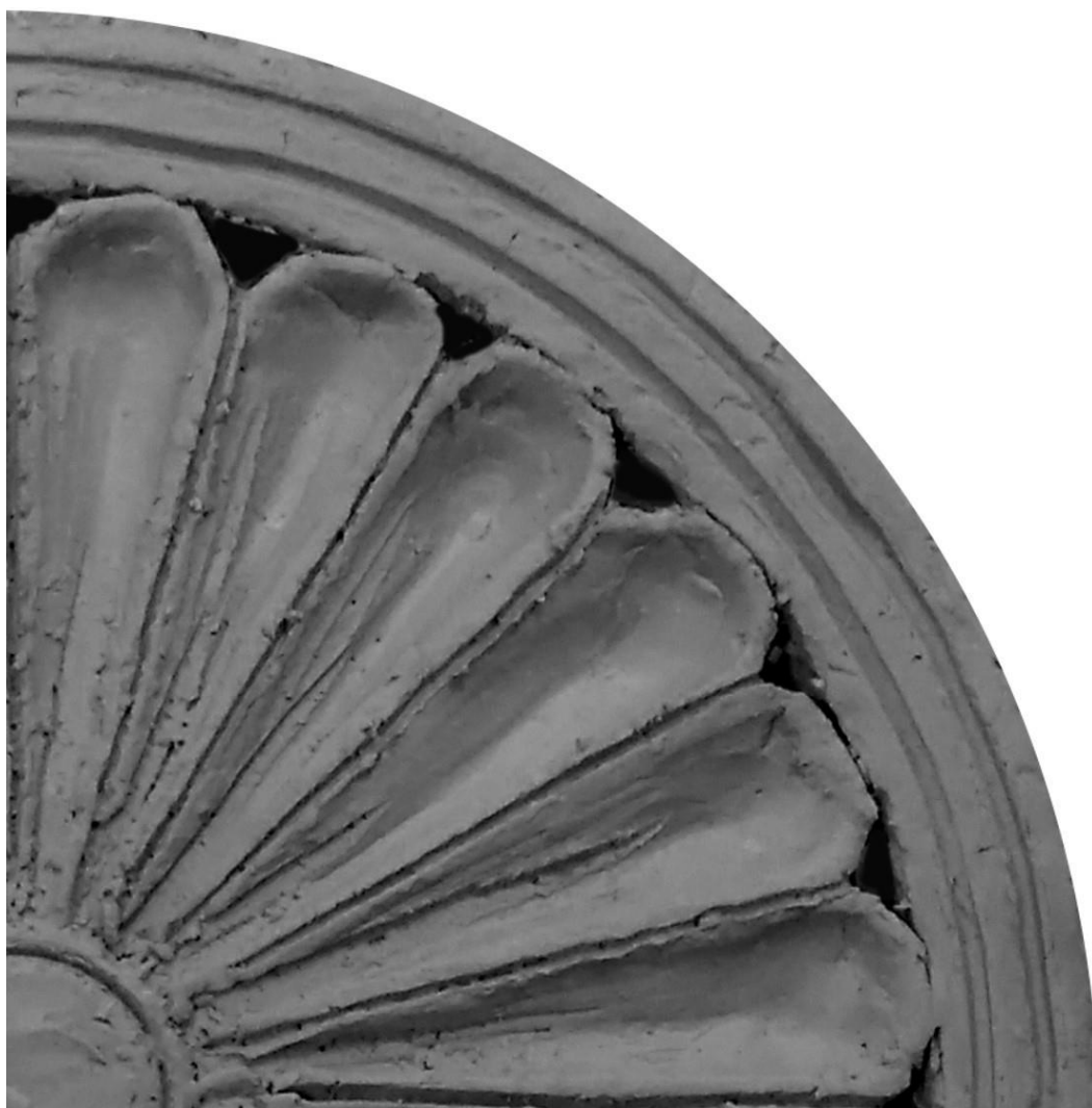
Rysunek 1. Ortogonalny widok fragmentu rozety do wykonania