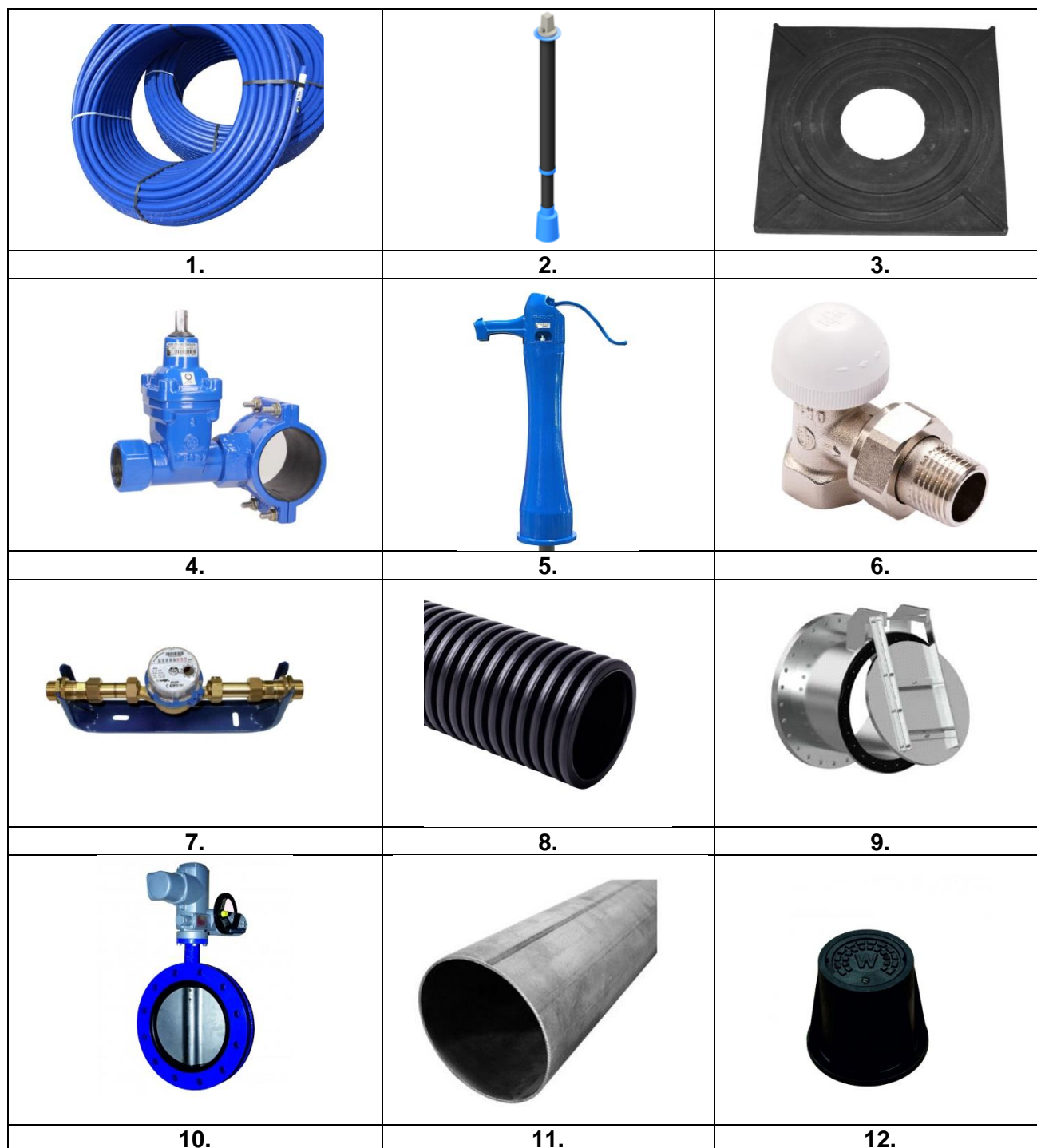
Tabela. 1. Zestawienie przewodów i armatury

Czas przeznaczony na rozwiązanie zadania wynosi 120 minut.