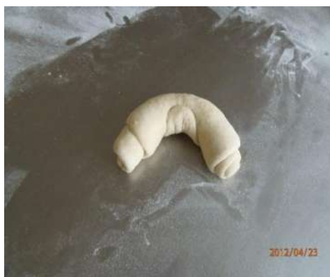
Rysunek 1. Formowanie rogali

Czas na wykonanie zadania wynosi 180 minut.