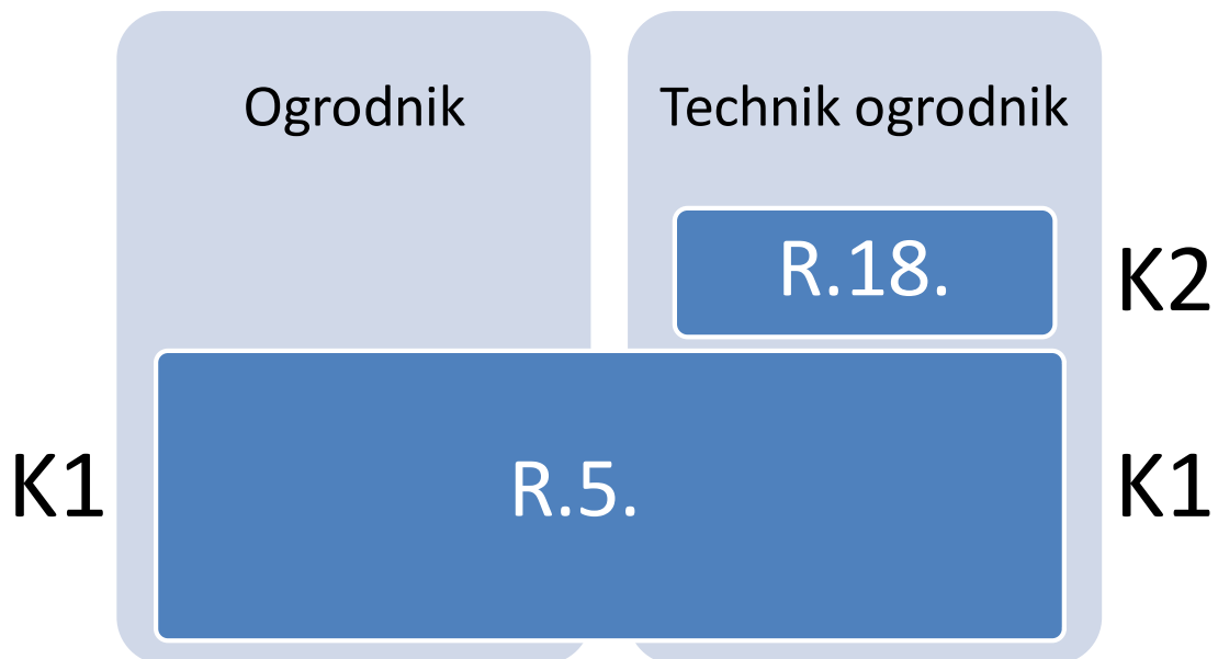
Rysunek M2.1. Zależności między zawodami ogrodnik i technik ogrodnik

Szczegółowe informacje o zawodzie technik ogrodnik znajdują się w publikacji Informator o egzaminie potwierdzającym kwalifikacje w zawodzie – Technik ogrodnik 314205 .