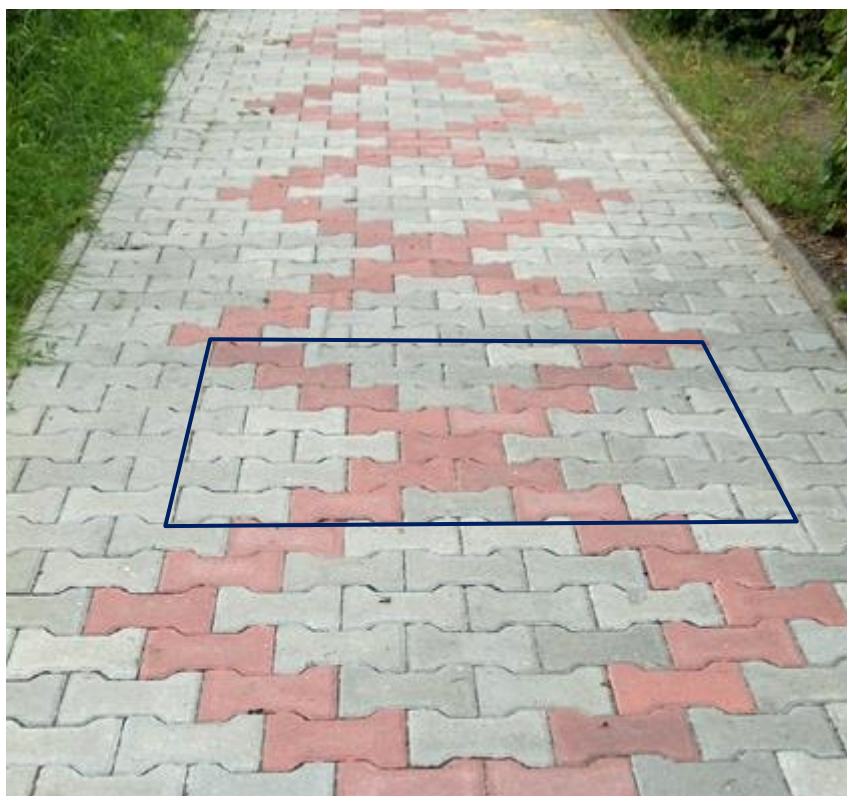
Rysunek 1. Nawierzchnia chodnika z zaznaczonym fragmentem wzoru

Po wykonaniu zadania oczyść używane narzędzia i uporządkuj stanowisko pracy.