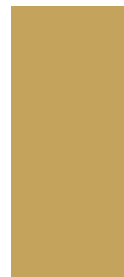
wzorzec koloru złotego CMYK (0, 20, 60, 20)