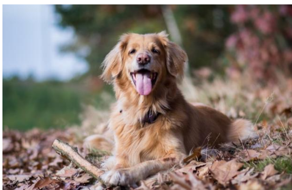
zdjęcie psa z pliku pies.jpg