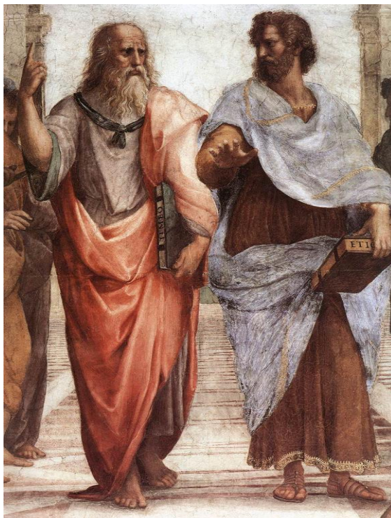
Rafaël Santi, Szkoła ateńska (fragment), 1509 – 1511, Stanze della Segnatura, Watykan

Poniżej jest fragment słynnego malowidła ściennego Rafaela z początku XVI w. „Szkoła ateńska”. W centrum malowidła są dwaj najstynniejsi filozofowie starożytności: Platon i Arystoteles.