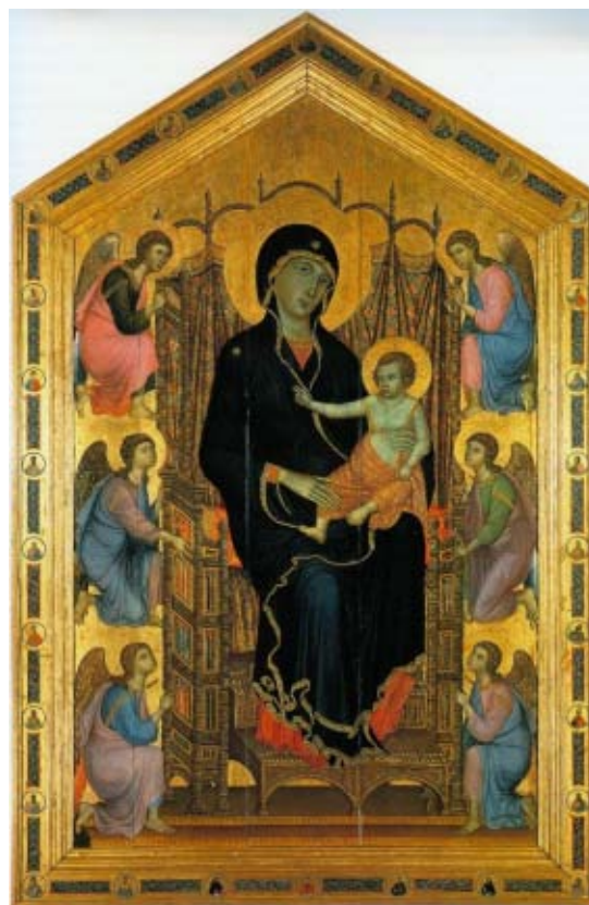
Duccio di Buoninsegna, Madonna Rucellai

Malarze sienneńscy czerpali inspirację ze sztuki bizantyjskiej. Na przykładzie obrazu, którego autorem jest Duccio di Buoninsegna, wymień dwie cechy formalne dzieła, które świadczą o tej inspiracji.