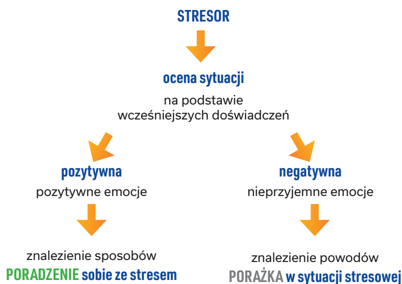
Ryc. 2. Interpretacja sytuacji stresowej 4

Jeśli nierealistyczne przekonania nie są Ci obce, postaraj się z nimi walczyć. Kiedy pojawiają się w Twojej głowie, powiedz swoim myślom: „STOP”. Staraj się też zastępować je myślami budującymi (patrz: tabela nr 2).