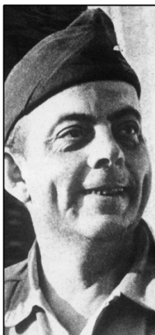
Antoine de Saint Exupéry

Na jednej ze stron internetowych dotyczącej lektur szkolnych zamieszczono krótką notatkę o okolicznościach powstania Małego Księcia . Niestety, jedno ze zdań zapisano niezgodnie z obowiązującymi regułami interpunkcyjnymi. Wybierz zdanie, w którym interpunkcja jest niepoprawna .