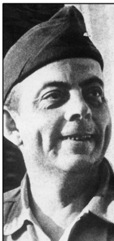
Antoine de Saint-Exupéry

Na jednej ze stron internetowych dotyczącej lektur szkolnych zamieszczono krótką notatkę o okolicznościach powstania Małego Księcia . Niestety, jedno ze zdań zapisano niezgodnie z obowiązującymi regułami interpunkcyjnymi. Zaznacz zdanie, w którym interpunkcja jest niepoprawna .