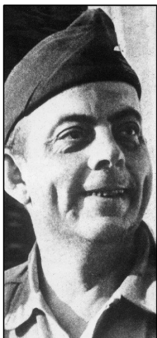
Antoine de Saint Exupéry

Na jednej ze stron internetowych dotyczącej lektur szkolnych zamieszczono krótką notatkę o okolicznościach powstania Małego Księcia . Niestety, jedno ze zdań zapisano niezgodnie z obowiązującymi regułami interpunkcyjnymi. Wybierz zdanie, w którym interpunkcja jest niepoprawna .