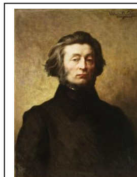
Adam Mickiewicz (1798–1855) – jeden z najwybitniejszych poetów polskich, działacz polityczny, publicysta.

Na krawędziach naczyń stoją dla ozdoby Niewielkie, z porcelany wydęte osoby W polskich strojach; jakoby aktory na scenie,